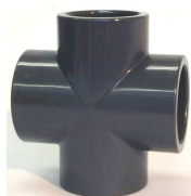
XIV - kříž